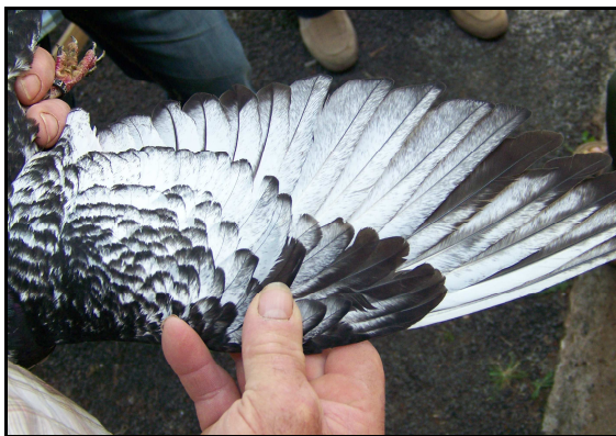
Sujet n'ayant pas fini la mue de ses rémiges