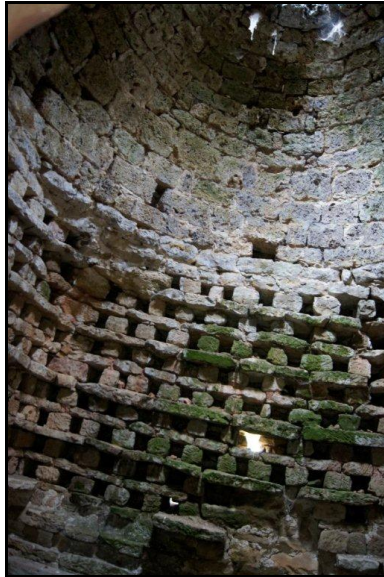
Intérieur du pigeonnier de Turenne