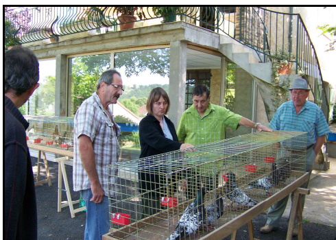
Débat autour des cages