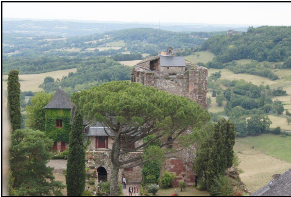
Château de Turenne, village d'accueil du TNB en France entre 1095 et 1204