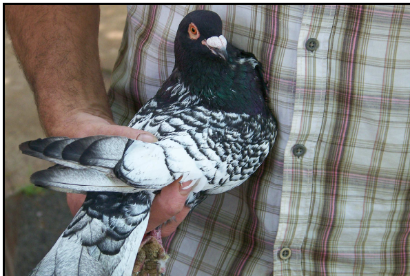
Beau sujet, la bordure noire des rémiges pourrait être plus fine