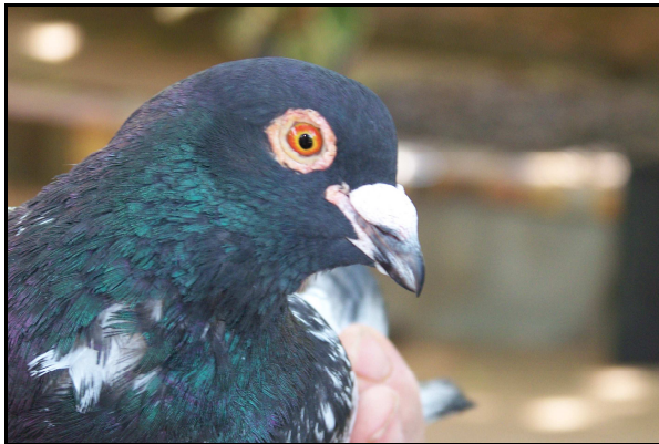
Bonne tête, bon oeil