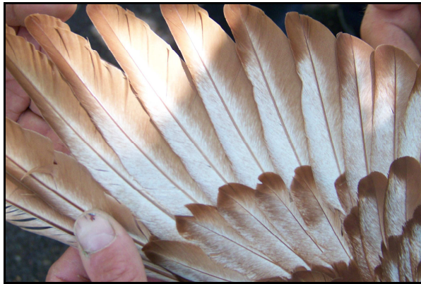
Aile d'un Lynx rouge vol plein, presque notre protégé en rouge