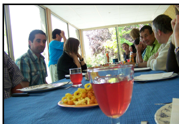
Moment de convivialité autour de la bonne table de la Prade