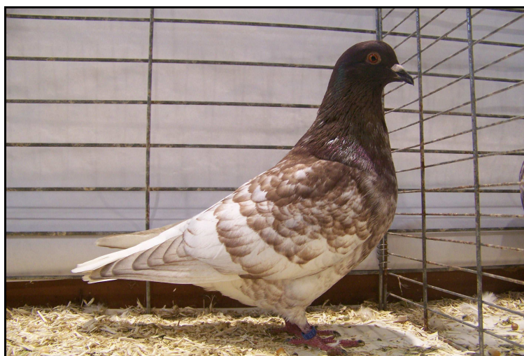
TCB rouge à Emmanuel GELE (95 pts)