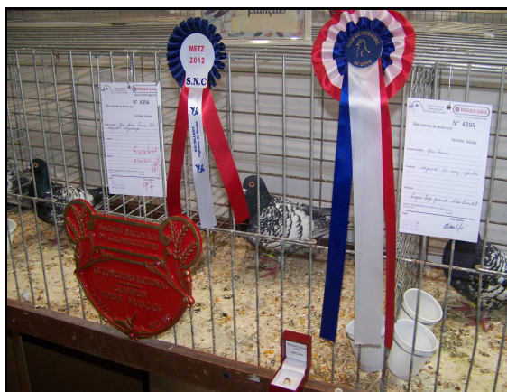
Super Championne du TCB et Champion des pigeons de forme Français femelle