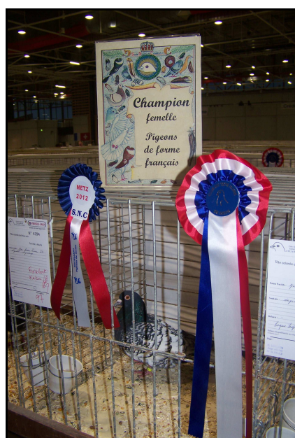
La super Championne 2012