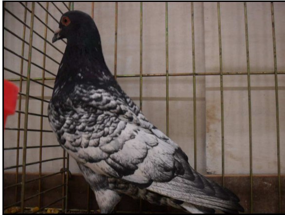
Champion Régional sud à Agnès Cheyssial (97 pts)