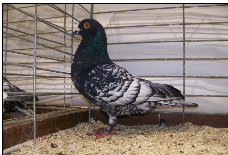
Championne de France femelle jeune à Alain DUHAMEL