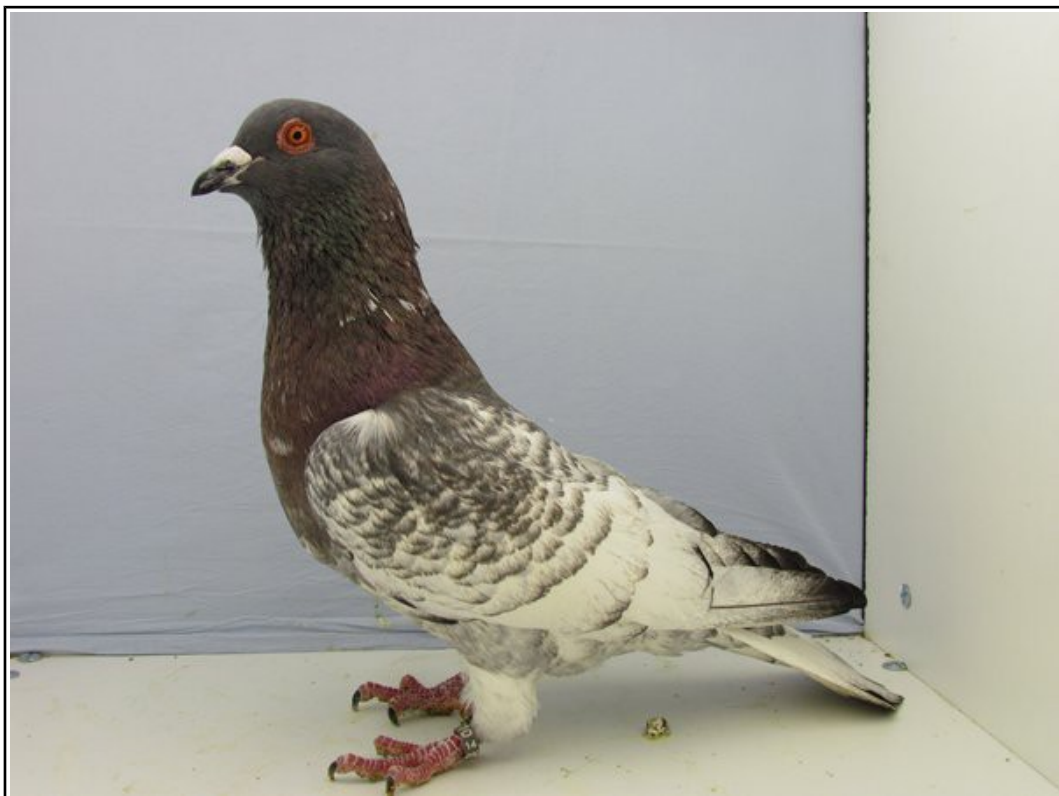
TCB bleu à Gilbert LASTERNAS (95 pts)