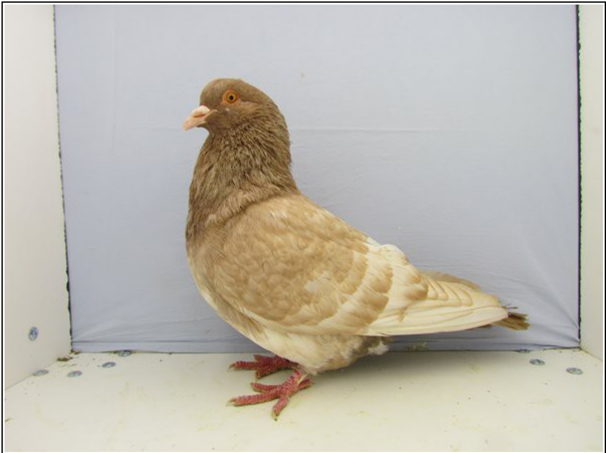
TCB jaune à Emmanuel GELE (92 pts)