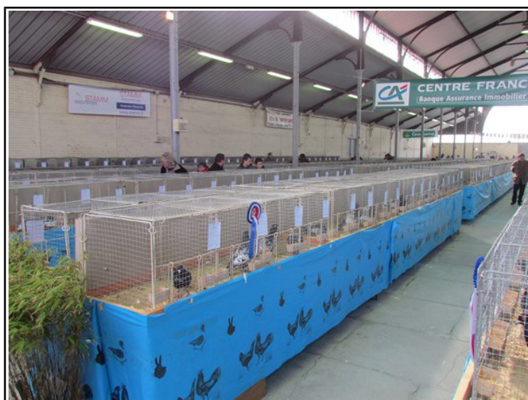
Championnat de France, hall de Cosnes d'Allier