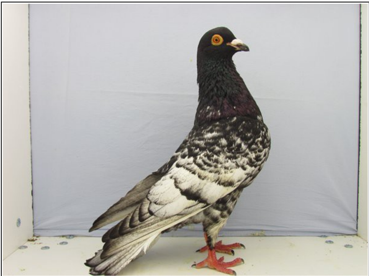
Championne de France femelle jeune à Benoit CRUBILIE