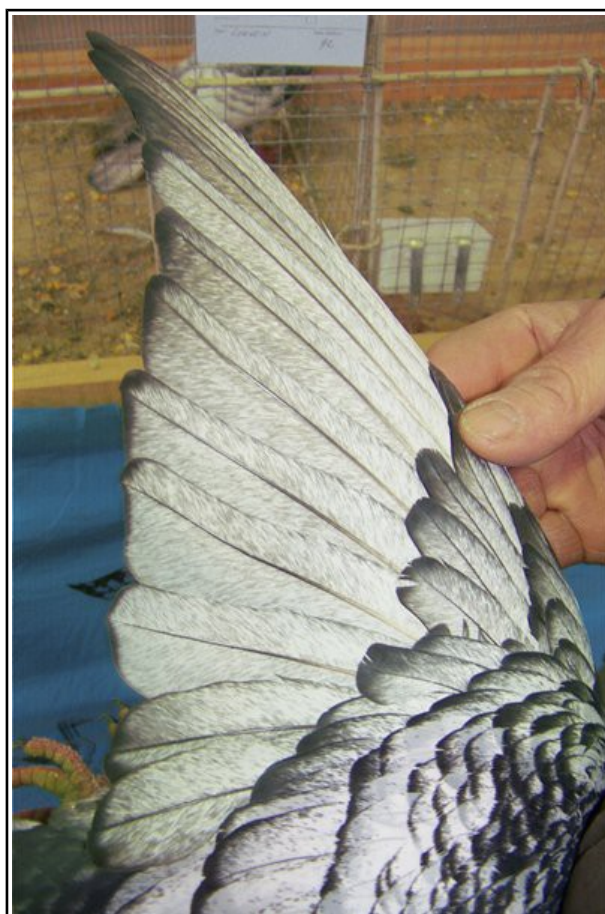
Beau déployé d'aile. Bordure fine et crayonnage des rémiges