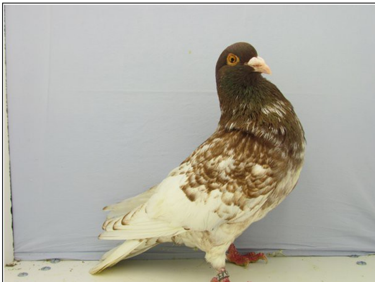
TCB rouge récessif à Emmanuel GELE (92pts)