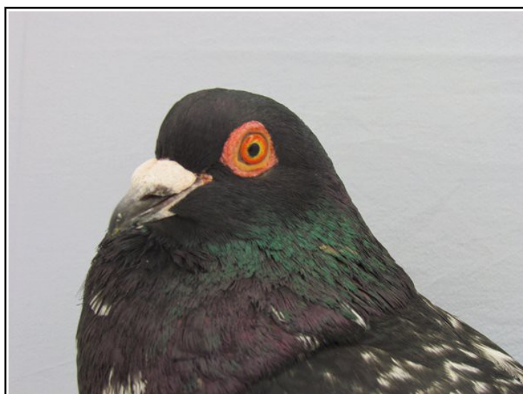
Bonne tête chez un TCB noir